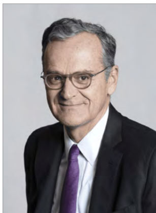
Roch-Olivier Maistre Président de l'Arcom

C'est un très grand plaisir pour l'Arcom de mobiliser pour la troisième édition consécutive les médias audiovisuels autour des acteurs, des valeurs et des réussites du parasport. L'opération « Jouons ensemble », lancée en 2021 à l'initiative du régulateur et à l'occasion de la retransmission des Jeux paralympiques de Tokyo, promeut une vision inclusive du sport auprès de tous les publics et contribue à une juste représentation du handicap sur les antennes.