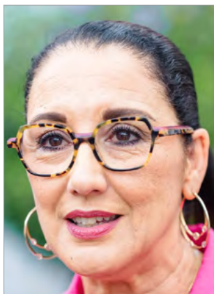
Fadila Khattabi Ministre déléguée chargée des Personnes handicapées