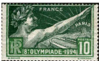
Timbre et médaille des Olympiades de 1924

La fondation présente également une exposition sur le même thème, réalisée en partenariat avec l'INSEP, jusqu'au 21 novembre 2017.