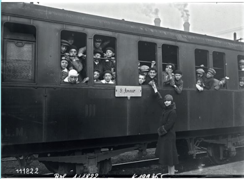
Gare de Lyon, départ d'une colonie de vacances, 1926, 1 photogr. nég. sur verre, 13 x 18 cm. BnF, Département Estampes et photographies - E1-19 (1949).

La première séance d'un cycle poursuivant le programme de recherche commencé en 2018 sur l'éducation populaire , programme déjà largement présenté et commenté dans les précédentes lettres du CHMJS, aura lieu le mardi 9 avril 2019, de 14h à 17h, aux Archives nationales à Pierrefitte-sur-Seine (auditorium).