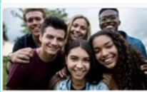
Missions et programmes

En effet, ces ministères se sont construits au travers de Missions et programmes , grâce à ses Personnels , de Statuts et fonctions divers, qui ont travaillé et travaillent encore dans ses Structures , le tout étant prévu par des Textes de référence .