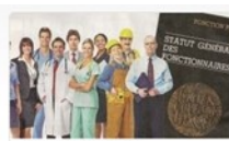
Statuts et fonctions