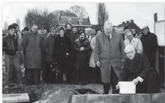
Pose de la première pierre du mille-club de Douai, par le maire de la ville, en 1974.

François Missoffe avait besoin de trouver ses marques par rapport à son célèbre prédécesseur Maurice Herzog. Il lança l'opération dès 1967, au grand dam des mouvements de jeunesse qui s'en trouvaient exclus de fait. Quels en furent les effets ? Au croisement d'une politique de jeunesse et d'une politique d'équipement, cette territorialisation de l'action publique, sorte de décentralisation avant l'heure, a été diversement appréciée à l'époque.