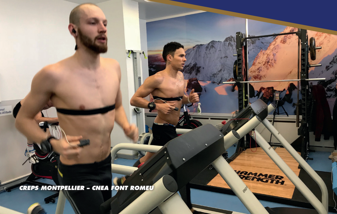
CREPS MONTPELLIER - CNEA FONT ROMEU