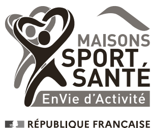
Version en Noir