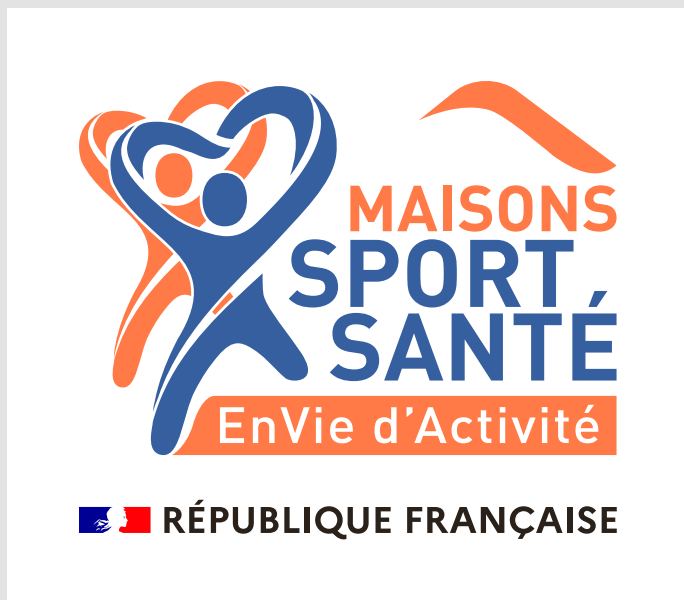
Logotype avec cartouche simplifié