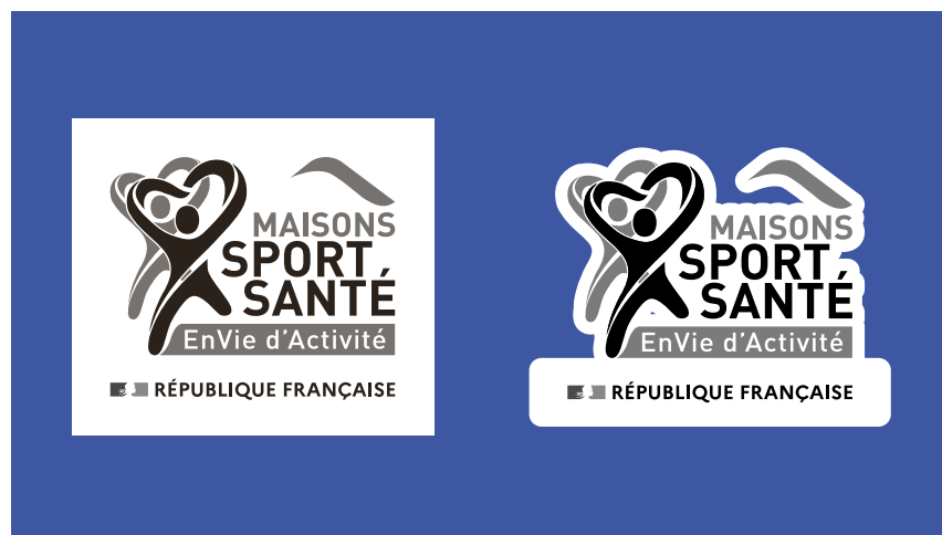
Déclinaison du logo en niveaux de gris